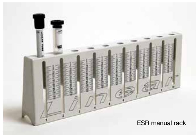
ESR manual rack

5310010 ESR manual rack 10 pos. 30 minutes result